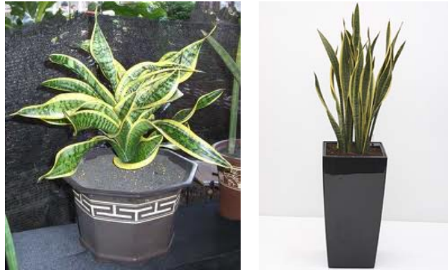
Gambar 5 Contoh tanaman jenis sansiviera

Tanaman yang banyak menghasilkan O 2 antara lain adalah jenis sansiviera, tanaman jenis puring, tanaman jenis palem, jenis bambu, jenis tanaman peace lily , English Ivy , tanaman-tanaman tadi bisa berfungsi sebagai antipolutan, dapat mengurangi efek polusi. Tanaman ini sudah tidak asing lagi bagi masyarakat, mudah dicari dan harganya tidak terlalu mahal.