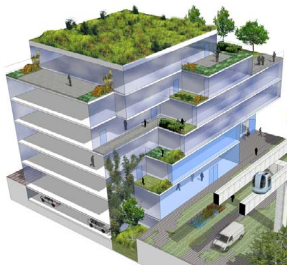
Gambar 1 Roof Top Garden

Makna dari konsep Green Architecture , atau Green Building adalah suatu pendekatan perencanaan bangunan yang berusaha untuk meminimalisasi berbagai pengaruh membahayakan pada kesehatan manusia dan lingkungan. Sebagai pemahaman dasar dari arsitektur hijau yang berkelanjutan, bagian dalam bangunan tersebut harus memiliki lansekap, interior, yang harus diusahakan dapat menyatu dalam kesatuan arsitekturnya. Sebagai contoh kecil, arsitektur hijau bisa juga diterapkan disekitar lingkungan kita. Yang paling ideal adalah menerapkan komposisi perbandingan 60 : 40 antara bangunan rumah dan lahan hijau, termasuk upaya membuat atap dan dinding dengan konsep roof garden dan green wall dalam hal ini, dinding bukan sekadar beton atau batu alam, melainkan dapat ditumbuhi tanaman merambat.