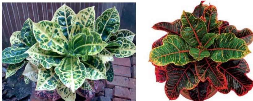
Gambar 7 Tanaman jenis puring, Sumber www.google.com/image