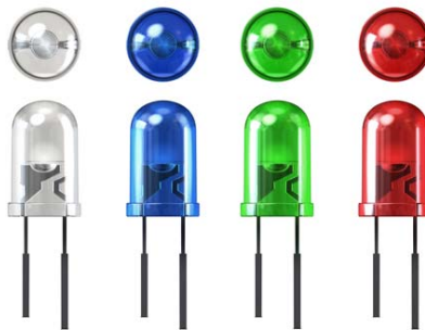
Gambar 2 SLED light bulbs

Dalam memaksimalkan cahaya alami dan ventilasi kita dapat memasang pencahayaan dengan sistim dimmer sehingga volume terang gelap cahaya yang dibutuhkan atau tidak dibutuhkan dapat dikontrol secara individu. Memasang lampu listrik hanya pada bagian yang intensitasnya rendah dan menggunakan lampu LED (atau kepanjangannya Light Emitting Diode ). Pencahayaan terang lampu LED tidak hanya dapat menghemat energi hingga 85% jika dibandingkan bola lampu tradisional, namun juga ramah lingkungan dengan cahaya terang bernuansa putih alami yang nyaman untuk mata. Lampu LED yang memiliki cahaya terang, dapat bertahan hingga 15 tahun dalam pemakaian (Santoso, 2014).