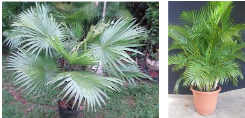
Gambar 6 Tanaman Jenis palem

Tanaman yang banyak menghasilkan O 2 antara lain adalah jenis sansiviera, tanaman jenis puring, tanaman jenis palem, jenis bambu, jenis tanaman peace lily , English Ivy , tanaman-tanaman tadi bisa berfungsi sebagai antipolutan, dapat mengurangi efek polusi. Tanaman ini sudah tidak asing lagi bagi masyarakat, mudah dicari dan harganya tidak terlalu mahal.