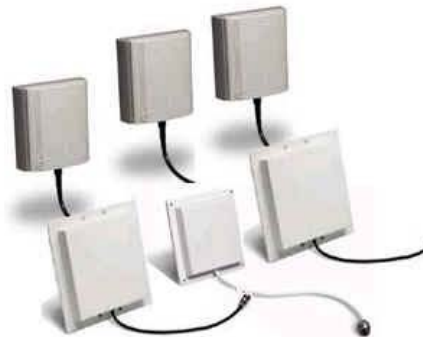
Gambar 2. RFID reader.

Berdasarkan mobilitas reader -nya RFID dibedakan menjadi: (1) mobile RFID reader/terminal RFID reader ada dua model: internal (sudah terintegrasi dengan mobile terminal ) dan eksternal (dalam bentuk CF card dan bluetooth koneksi); (2) vehicle-mounted RFID reader – dipasang pada kendaraan/ forklift yang dipakai untuk kegiatan peletakkan/ put-away maupun pengambilan/ picking dari pallet atau barang yang telah dilekatkan RFID tag ; (3) fixed RFID reader – dipakai dalam penerapan “ fixed reading gate ”. Dalam hal ini, item secara fisik akan dibawa kedalam area baca dari reader yang bersifat stasioner. Contoh: access control. Fixed reader memiliki dua model: dengan antenna yang sudah terintegrate dan antenna eksternal. Berikut contoh RFID reader (Gambar 2).