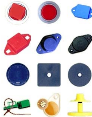
Gambar 1. Tag RFID aktif dan pasif.